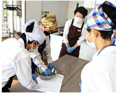
↑田中屋総本舗様で 笹団子作り体験

そして、あらかじめ訪問先について調べ学習をして準備をした後、5月31日(水曜)に職場訪問に出かけました。曽根駅から出発して西区、中央区、秋葉区の事業所に向かいました。実際に職場を訪問し、お仕事の内容を教えてくださいたり、体験をさせていただきました。ご協力いただいた事業所のみなさま、ありがとうございました。