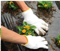
どうぞご覧ください。→